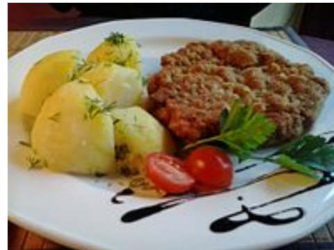
SCHNITZEL Cena típica