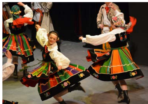
Dusza Polska Baile típico polaco