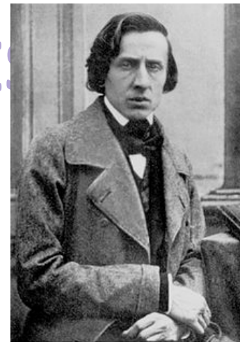
Pianista Chopin (uno de los más importantes de la historia)