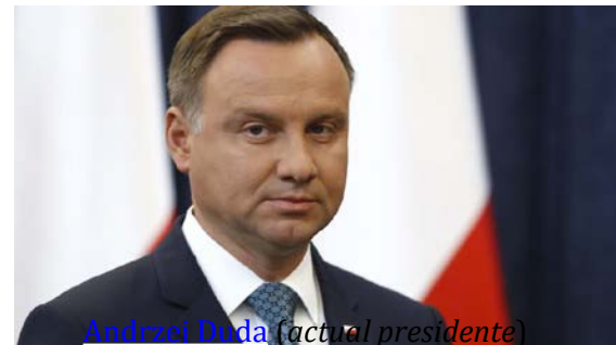
Andrzej Duda (actual presidente)

La estructura del gobierno se centra en el Consejo de Ministros , dirigido por el primer ministro , designado por el presidente. Por la repartición del poder ejecutivo entre el Presidente y el Primer ministro, se considera Polonia como un régimen semi presidencial . Los votantes polacos eligen un parlamento bicameral de un Sejm , la cámara baja y un Senat , la cámara alta.